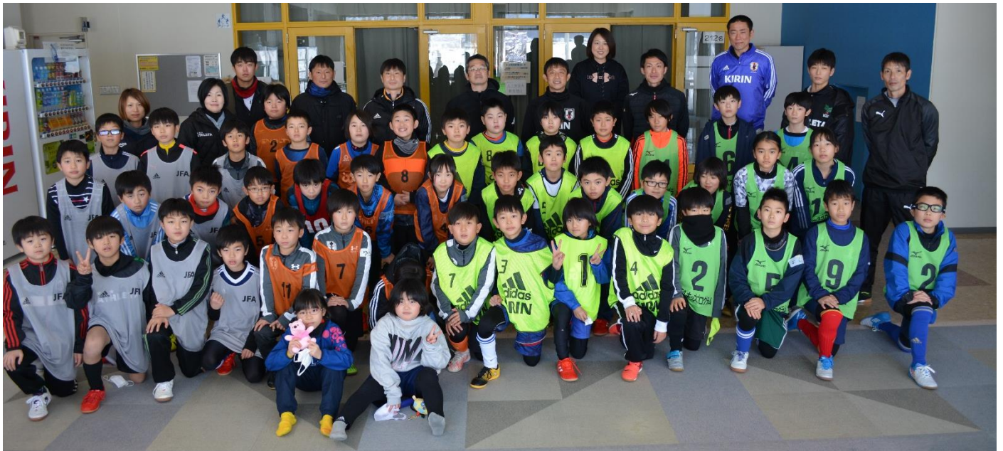
【1日目 ジャパンカップの様子】